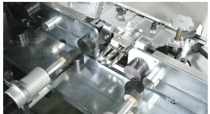
Détails de la console permettant le pivotement de 90° du profilé suivant son axe. Le blocage en position est pneumatique.